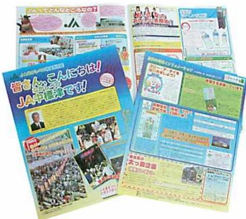
消費者向け広報紙などにより当JAの取組をアピール

手段を講じてまいりたいと考えておりますし、折に触れ、組合員の皆さまからも貴重なお意見をいただく機会を設けて、ともに一体の取り組みを実践してまいりたいと考えておりますので、ご理解、ご支援を賜りますようお願い申し上げます。 最後に、組合員・ご家族の皆さま、各関係機関のご健勝、ご発展を願ひ、就任の挨拶といたします。