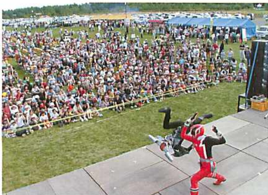
写真は昨年のキャラクターショーの様

今回は、キャラクターショーに魔法戦隊マジレンジャー。今年も特設ステージ上で行うので観覧しやすいです。また、