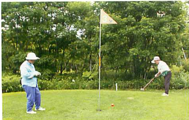
笑い声がたえなかったパークゴルフ交流

7月22日、道立ゆめの森公園パークゴルフ場にて女性部青葉会主催のパークゴルフ大会が行われ、14人が参加いたしました。