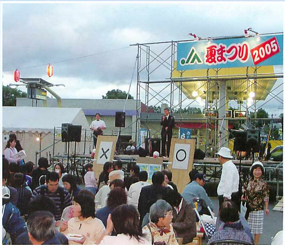
乾参事による来場者へのあいさつ