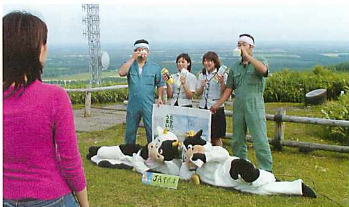
JA中標津の製品で「だからうまいんだっ」とPR

7月14日、開陽台でロケしました。 これは、NHKが全国津々浦々の方々を千人あまりロケした。