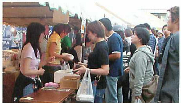
売場は長蛇の列に…