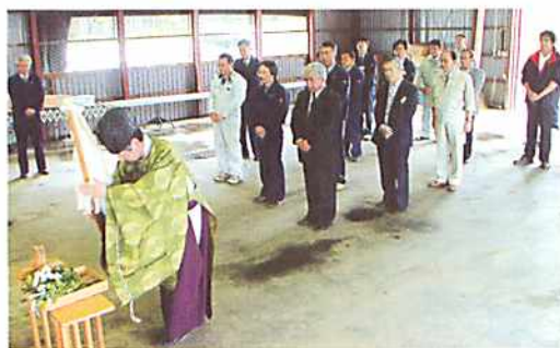
安全操業の願いを込めて

7月15日、当農協の「だいこん」と「プロッコリー」収穫が開始されるにあたり、役員や関係機関、耕作者などにより合同で安全祈願に