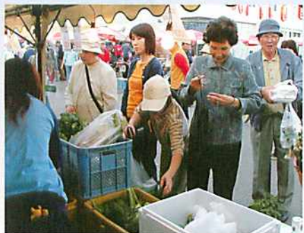
とれたて農産物も大盛況