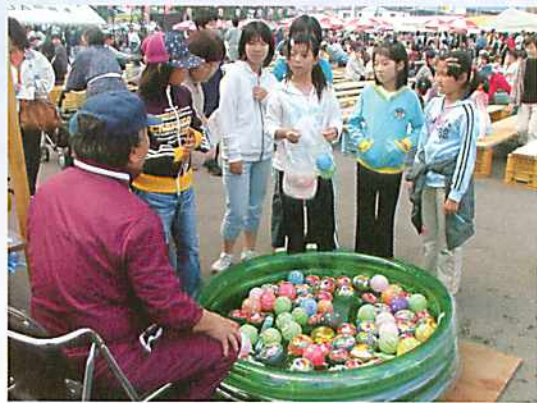
遊具も人気、ヨーヨー釣り