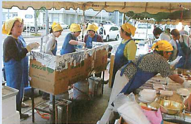
女性部はザンギで出店協力