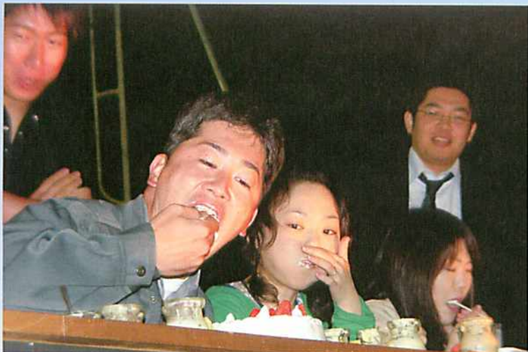
スイーツ大食いイベント。プリンにケーキに牛乳にかぶりつきました