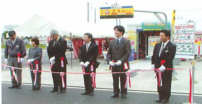
来賓・関係者がテープカット

8月の営業時間は、洗車場が7時30分から22時まで。給油施設が8時から19時30分まで。